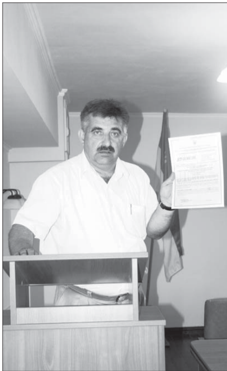
(Закінчення. Поч. на 1 стор.)

Завод залізобетонних конструкцій отримав сертифікат ISO 9001-2001