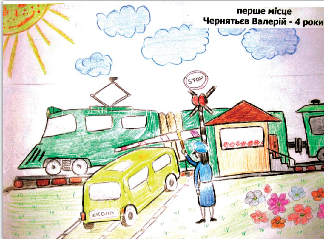
перше місце Чернятьєв Валерій - 4 роки