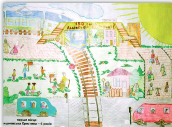
перше місце Вишневська Христина – 6 років