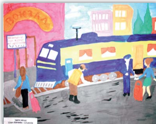
третє місце Савчук Дарина – 7 років