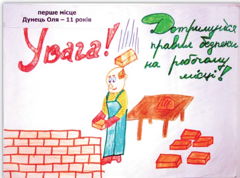
перше місце Дунець Оля – 11 років