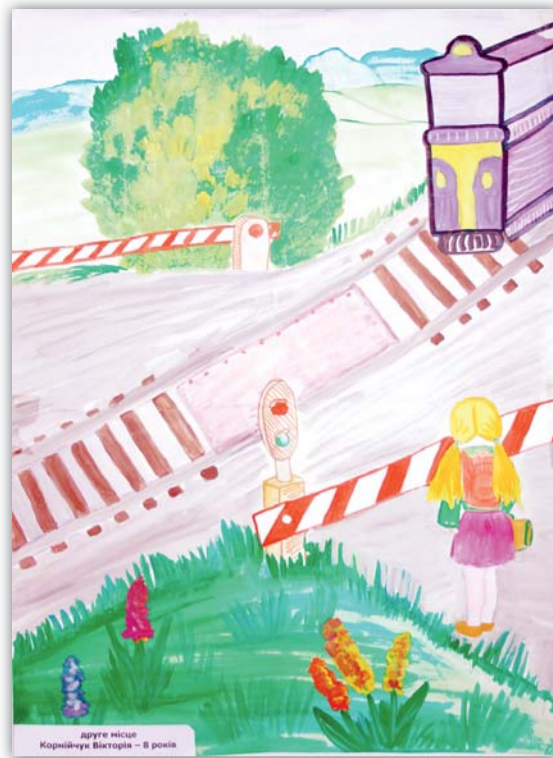
друге місце Корнійчук Вікторія – 8 років