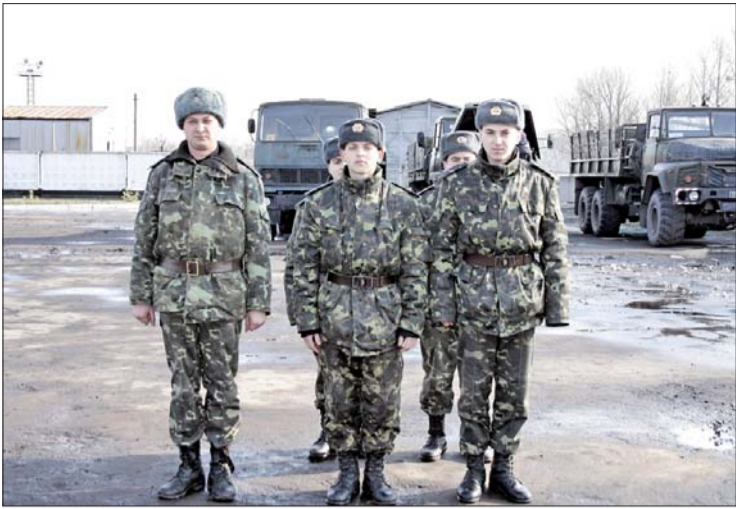
(Закінчення. Поч. на 1 стор.)

– Сьогодні особовий склад виконує навчально-практичні роботи у п'ятих областях Західної України. Ми працювали у Волинській, Вінницькій, Тернопільській, Івано-Франківській, Чернівецькій та Рівненській областях, виконували роботи зі встановлення габійних конструкцій. Значний обсяг робіт виконано із берегоукріплення та