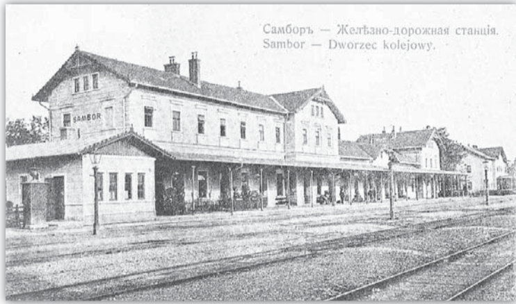
Самборь — Жельзно-дорожная станция. Sambor — Dworzec kolejowy.

Місто Самбір – важливий залізничний вузол Прикарпаття. Залізниця прийшла сюди у 1872 році із побудовою лінії Перемишль–Хирів–Самбір–Стрий. У 1903 році залізниця сполучила Львів із Самбором, а в 1905-му – із Закарпаттям через Ужгородський перевал (Самбір–Сянки). У 1967–1968 роках залізничні лінії зі Самбора до Львова та Ужгорода, а в 1974 році – до Дрогобича були електрифіковані. У 1961 році в Самборі було побудовано нове приміщення залізничного вокзалу, яке у 2000 році реконструйоване. Самбір розташований на лівому березі Дністра, серед лісів,