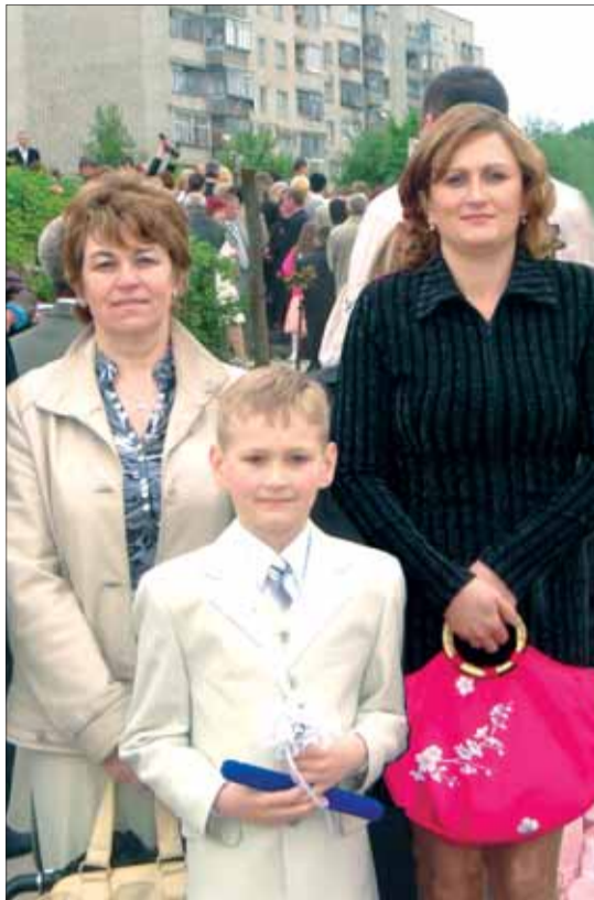
Морально я тримаюся, а матеріально – дуже важко.