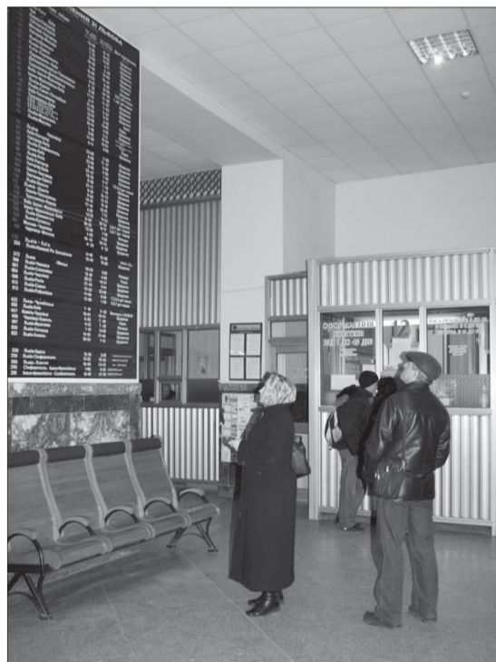
Попередній продаж проїзних документів на всі інші поїзди у чинному графіку руху здійснюється, як і раніше, за 45 діб до дати відправлення.

Основною метою впровадження послуги є розширення можливостей пасажирів, які мають змогу завчасно замовити та придбати квиток у залізничній касі чи за допомогою мережі Інтернет. А залізничники у свою чергу матимуть можливість відслідковувати попит та населеність поїздів і заздалегідь приймати рішення про призначення додаткових. Особливо актуальними такі заходи є напередодні свят, коли значно зростає попит на пасажирські перевезення в окремих напрямках.